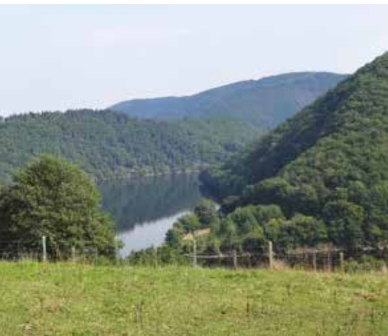
De Rursee op de achtergrond.