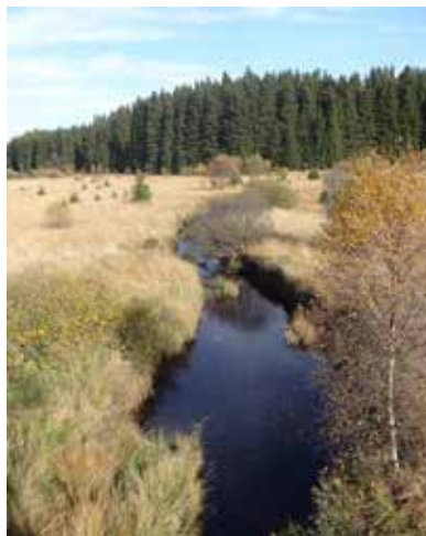
Diezelfde Rur in de Hoge Venen.