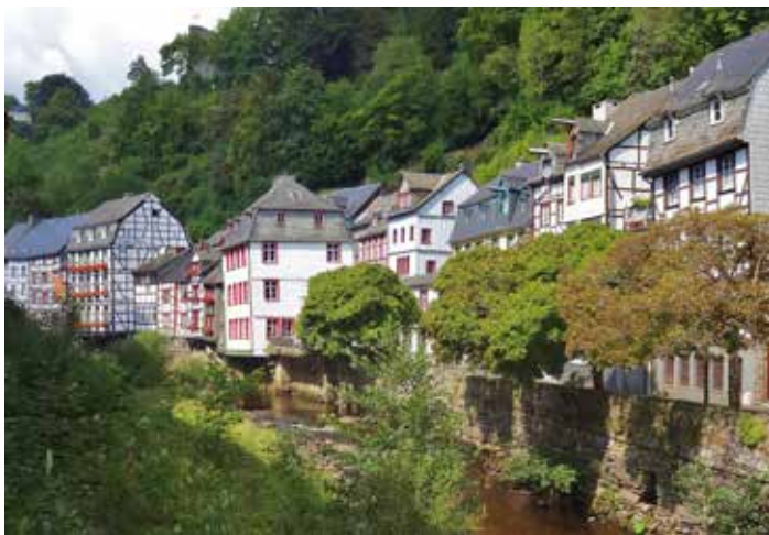
Monschau aan de Rur.