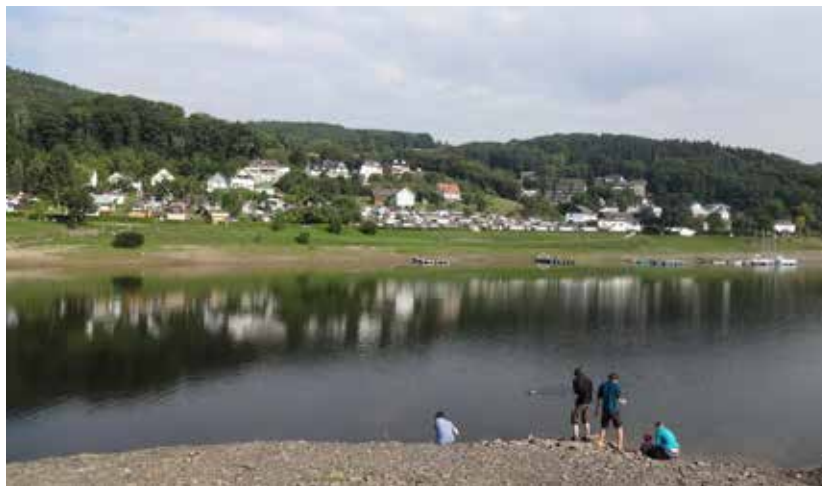
Het gezellige Woffelsbach op de oever.

al 40 km afgelegd, 380 hoogtemeters in dalende lijn. Na 165 km en 643m lager dan haar bron mondt ze als Roer uit in de Maas bij Roermond.