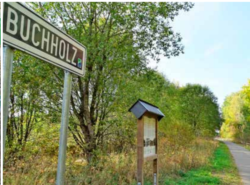
Op de Vennquerbahn.