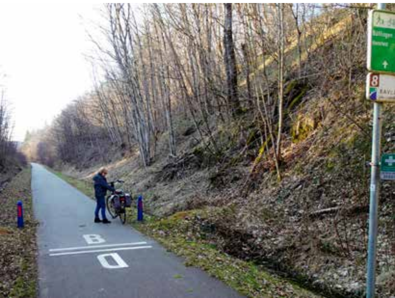
De grens over.